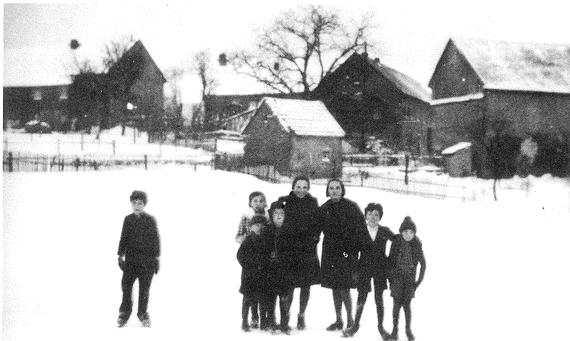
Der 1840 errichtete „Mikweh“ oder das „Badehäuschen“, wie es die Bosener nannten, befand sich neben „Polacks Haus“, dem Haus Säger, heute Brückenstraße. Das Bild ist von der „Pfarrwiese“ aus aufgenommen. Im Vordergrund sind Bosener Jugendliche zu sehen, die im Winter dort ihre Schlittschuhbahn hatten.

Weitere Redensarten im Volksmund, wie beispielsweise: „Es geht zu wie in einer Judenschule“, „Der macht Geschäfte wie de Jud' von Worms“, „Er ist zäh wie ein alter Jud“, „Jetzt kommt ein Jud' in den Himmel“ zeigen, daß die Bevölkerung die rassistischen und religiösen Eigenheiten der Juden kannte. Hierzu gehörte auch die religiöse Vorschrift, wonach die jüdischen Frauen zur „gesetzlichen Reinigung“ das Frauenbad (Mikweh) besuchen mußten. In Zeiten, in denen persönliche Hygiene nicht Allgemeingut war, dürften diese Vorschriften zur Benutzung der „Mikweh“ (Tauchbad) auch einen gewissen