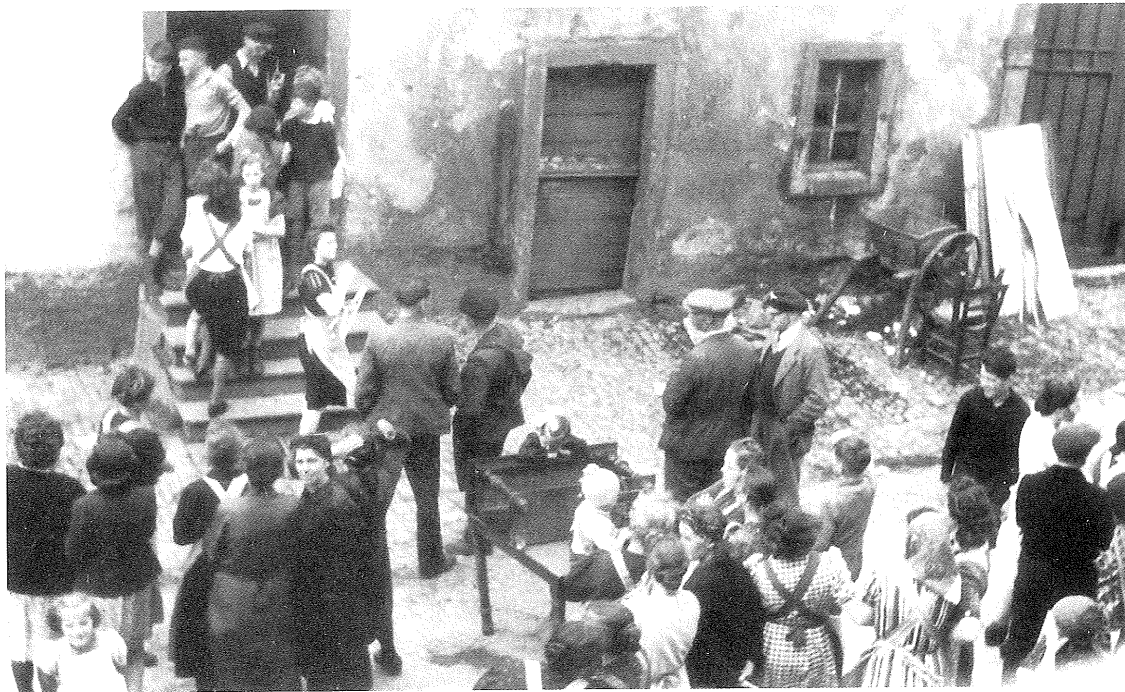
Eine „Judenversteigerung“ (Versteigerung der gesamten Habe, vom Grundstück bis zum Hausrat). – Während die „amtliche Kommission“ die öffentliche Versteigerung vornahm, durften die jüdischen Hausbewohner ihre Wohnung nicht verlassen. Sie mußten mit ansehen, wie ihr Eigentum verteilt wurde. Den Erlös aus der Versteigerung bekamen die Juden selbstverständlich nicht.