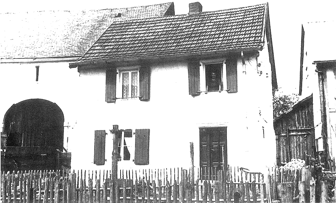
Eines der ältesten Bosener Häuser, das ehemalige jüdische Wohnhaus „Mades“, heute Haus Nikolaus Schmitt, Bostalstraße

Die frühe Ansiedlung jüdischer Einwohner in Bosen beweist, daß die Juden nicht nur über viele Generationen einen festen Platz in der Dorfgemeinschaft hatten, sondern auch das dörfliche Leben mitgestalteten und prägten. Viele werden sich natürlich die Frage stellen, warum gerade seit so früher Zeit Juden in Bosen wohnten.